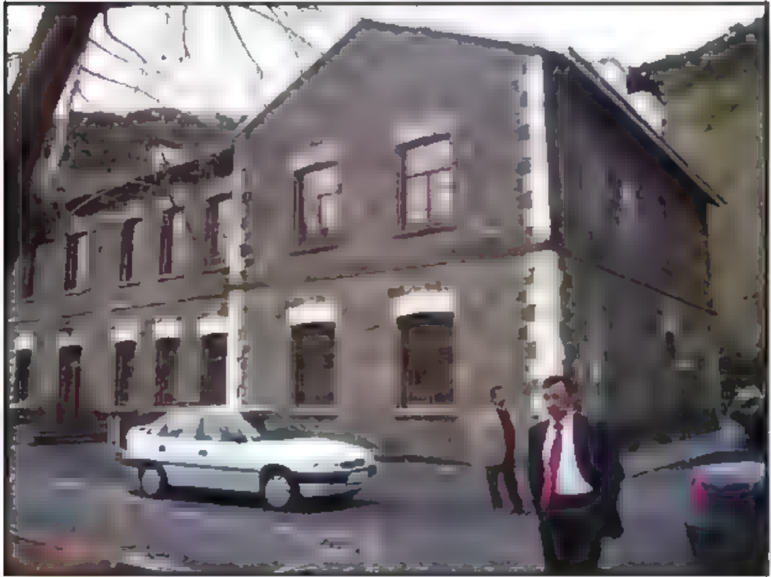
Kampüs İçinden Bir Kare